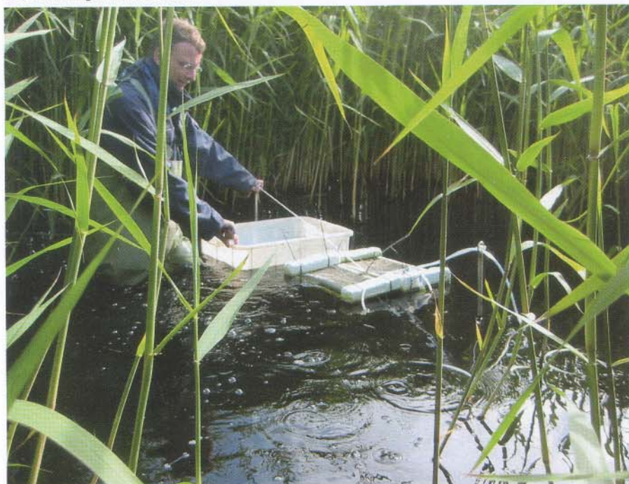
Kooi met blootgestelde stekelbaars

** Stichting Waterproef voert sinds 1 januari 2005 de laboratoriumactiviteiten uit van het Hoogheemraadschap Hollands Noorderkwartier en Waternet.