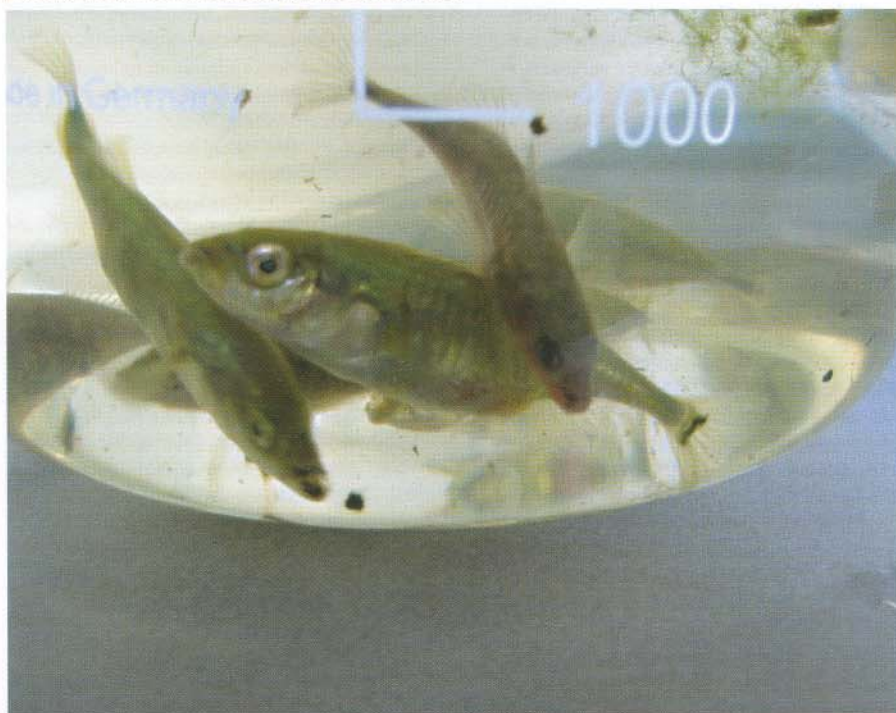
Enkele van de in het moeras blootgestelde stekelbaarsjes

Eind jaren negentig ging een grootschalig onderzoek van start naar aanwezigheid en effecten van stoffen die de hormoonhuishouding in het aquatisch milieu kunnen ontregelen. Dit landelijke onderzoek (Landelijk Onderzoek Estrogene Stoffen of afgekort LOES) gaf de eerste aanzet naar inzichten over de verspreiding van estrogene stoffen (stoffen met vrouwelijk hormonale werking) in het Nederlands milieu en hun effecten (vervrouwelijking) op vissen. Uit het onderzoek bleek dat oestrogenen grotendeels verwijderd worden in rioolwaterzuiveringen. Toch bleek dat de geringe hoeveelheid oestrogenen in het effluent soms effecten kunnen hebben op vis. Naast rwzi's (waar de hormonen uit urine terechtkomen) werden tijdens dit onderzoek ook andere bronnen geïdentificeerd, zoals industriële effluënten en uitspoelend water van intensieve veehouderij 1) . STOWA publiceerde in 2003 een overzichtsrapport over oestrogenen in het milieu, waaruit bleek dat voor een goede risico-beoordeling nog onvoldoende gegevens beschikbaar waren. Tevens werd in dit rapport onderschreven dat nog zeer veel